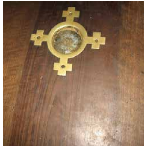
Кровь Спасителя (в окошке) на верхней 28 ступени