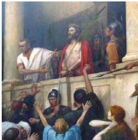
Еесе Номо ( Се человек), 1896. Михай Мунчано