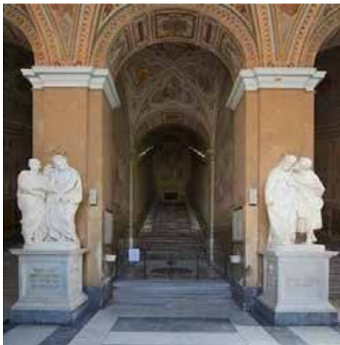
Джакометти .Суд Пилата и Поцелуй Иуды. У входа в Santa Scala