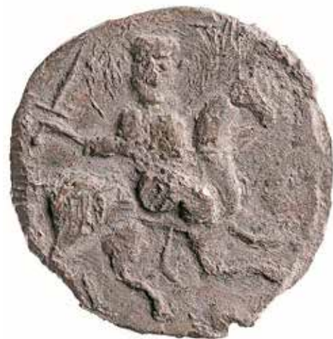
Печать княжеская Александра Ярославича