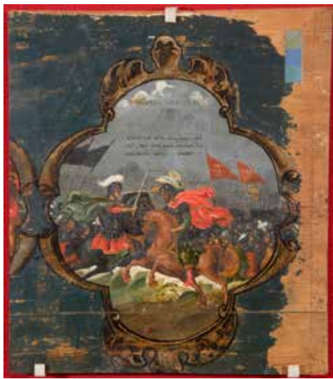
Икона (клеймо рамы-киота). Битва св. Александра

появилась легенда об иконе. Дело в том, что там хранилась древняя икона Богородицы. И вдруг стали говорить: это личная венчальная икона Александра Невского, та самая, которую привезла с собой невеста князя.