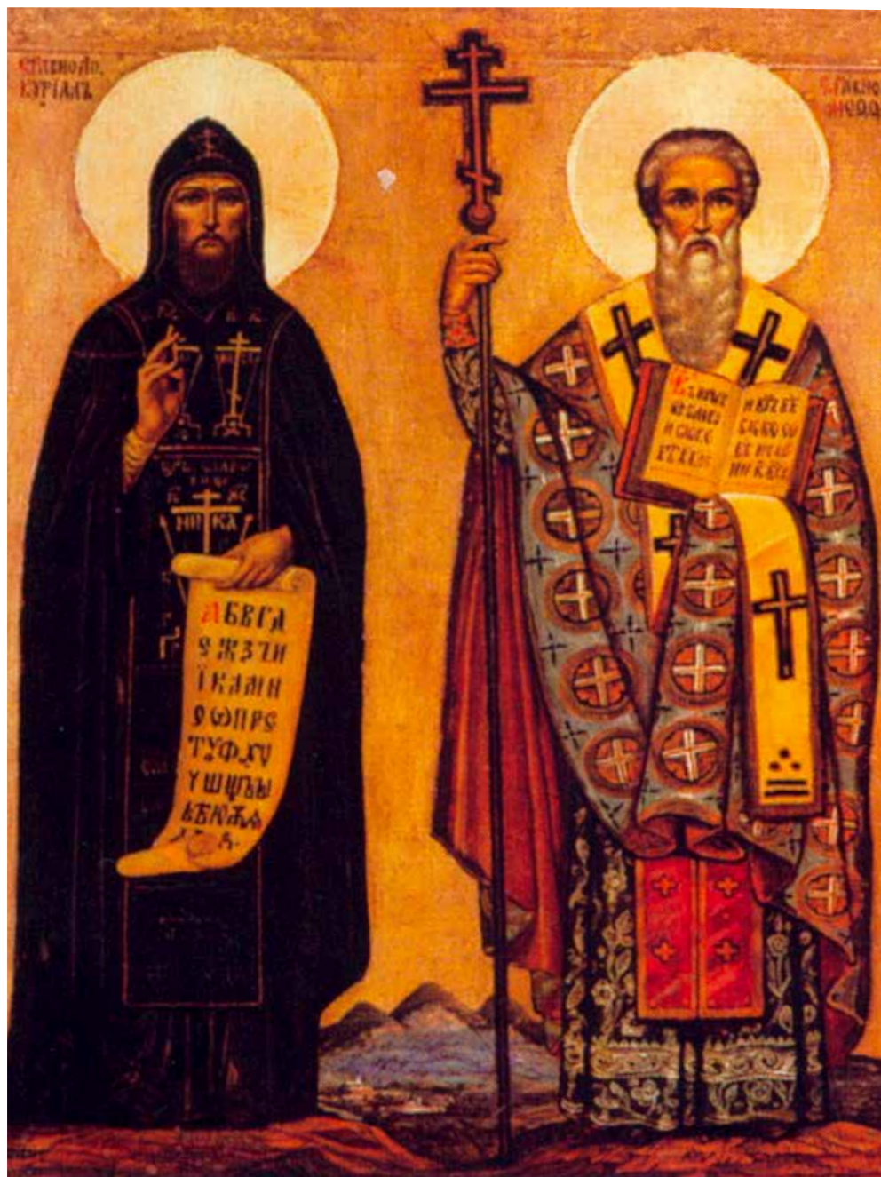
Святые Кирилл и Мефодий (икона XVIII—XIX веков)

Преподобный Софроний, затворник Печерский. Русский святой XIII столетия, совершавший монашеские духовные подвиги в Дальних (Феодосиевых) пещерах самой первой русской обители – Свято-Успенской Киево-Печерской Лавры. Известно, что старец Софроний носил власяницу и тяжёлый железный пояс, а также ежедневно полностью прочитывал Псалтырь.