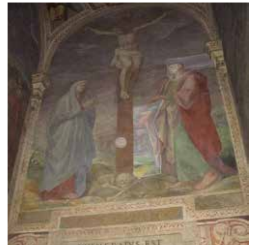
Фреска на стене храма в конце Scala Santa