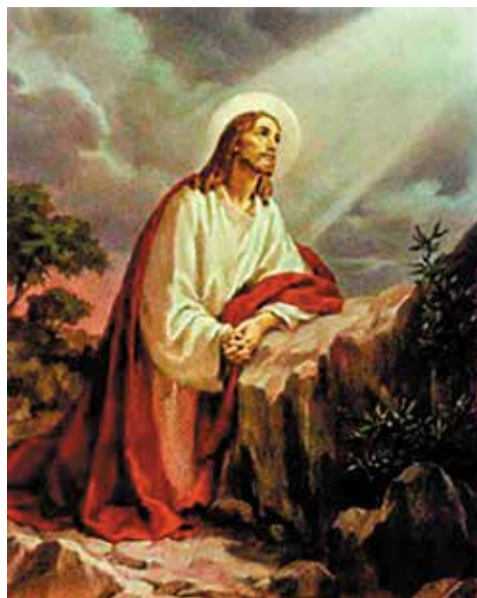
«Моление о чаше». Неизвестный художник

Очень тяжело находиться в бездействии в решительную минуту. В саду Гефсиманском из одиннадцати учеников, восемь были обречены на бездействие. Иисус ушѣл вперед, помолиться; Пѣтр, Иаков и Иоанн оставались на полдороге, как бы насто-